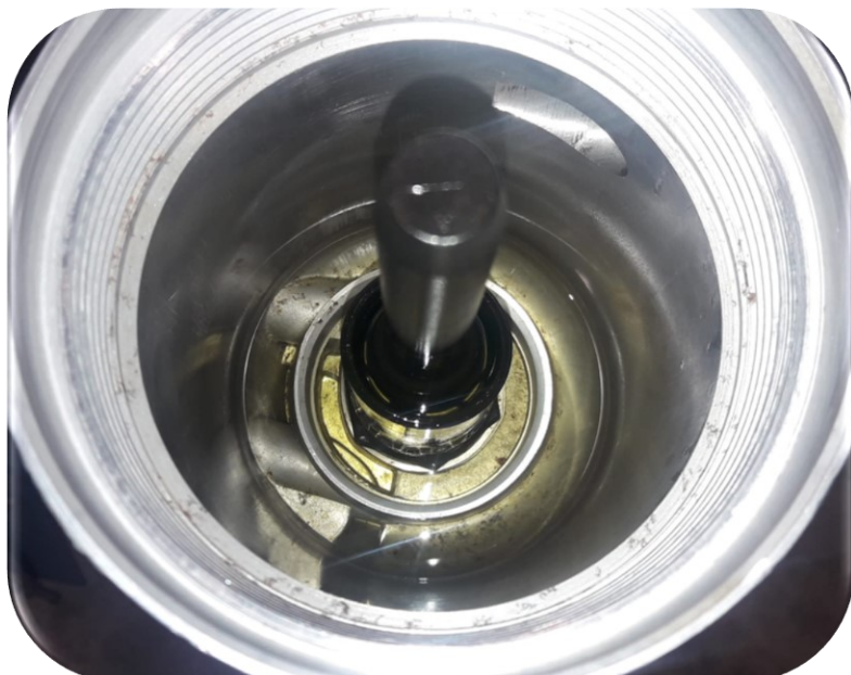
Foto rechtsboven vervuiling in het hoofdfilterhuis, ook op plaatsen waar de Diesel al gefilterd is.