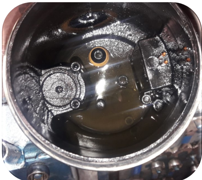
Foto linksboven plakkerige vervuiling in voorfilterhuis.